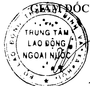
Hà Xuân Tùng